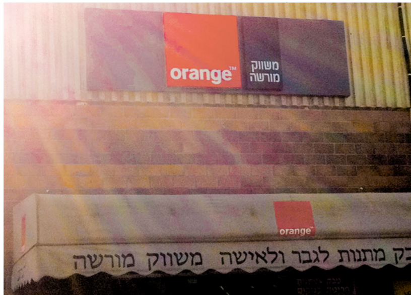
Boutique Orange située dans la colonie d'Ariel.

Mais l'État français est aussi et surtout actionnaire minoritaire principal en possession de 25,05 % du capital, et la seule entité qui, selon Orange, peut exercer un contrôle sur cette entreprise 16 . Sur les 15 membres du Conseil d'administration d'Orange SA, 3 représentent la sphère publique 17 . À cet égard, la France doit assurer la cohérence de ses politiques (entre les recommandations destinées aux particuliers et aux entreprises et le respect de leur mise en œuvre). Elle doit aussi prendre des mesures de protection additionnelles vis-à-vis des activités des entreprises dont elle est actionnaire, comme Orange, y compris des activités de ses relations d'affaires, et user de sa capacité d'influence pour veiller à la mise en œuvre d'une diligence raisonnable par Orange.