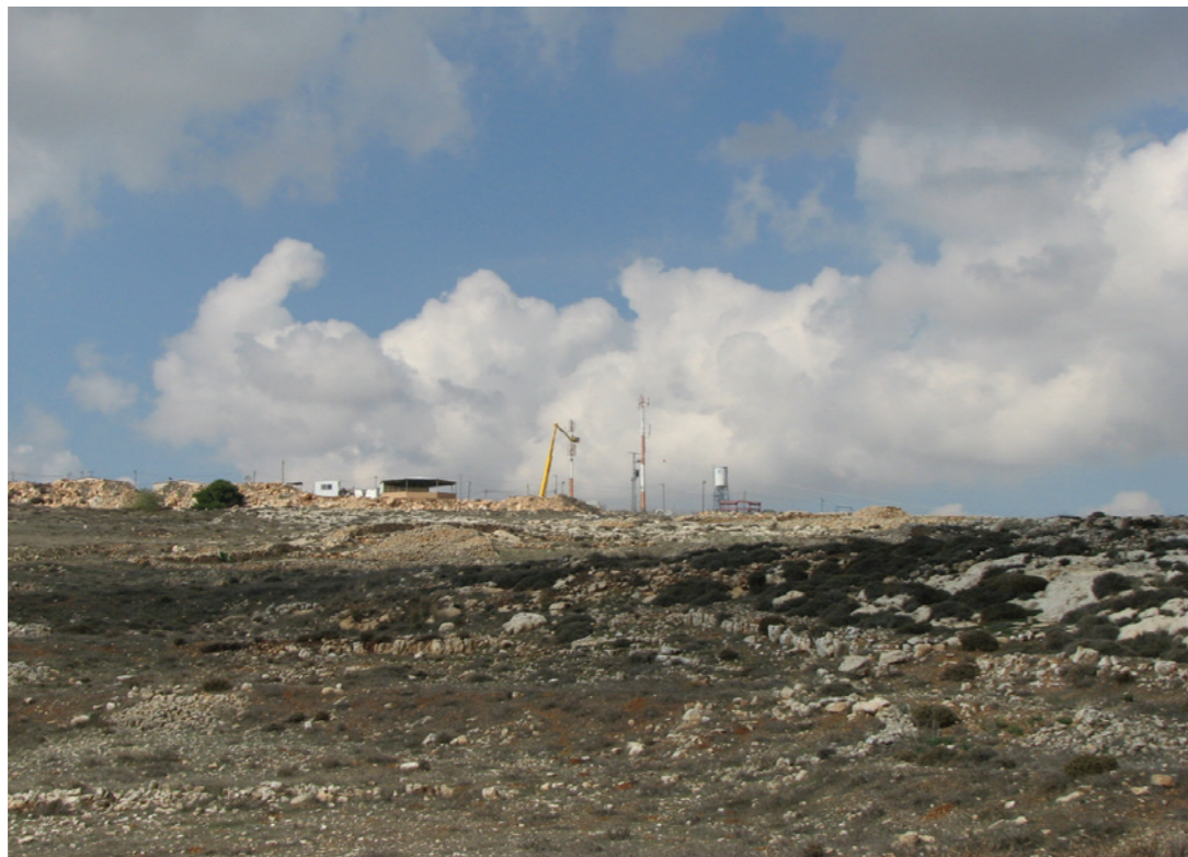
Antenne Partner Communications située dans l'avant-poste de Migron.

Ces informations ont été sélectionnées, recoupées et complétées par un travail d'analyse des auteurs de ce rapport. Interrogés par courrier par les auteurs de ce rapport, Orange et le gouvernement français n'ont à ce jour pas répondu. Le 28 avril, dans la phase d'impression du rapport, Orange a pris contact avec les auteurs de ce rapport pour proposer une rencontre. La dernière demande de rendez-vous des auteurs date du 20 février 2015.