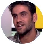
Iyad ALASTTAL Réalisateur de Gaza : Gaza Stories, Gaza Balle au pied, Razan, Une trace du papillon.